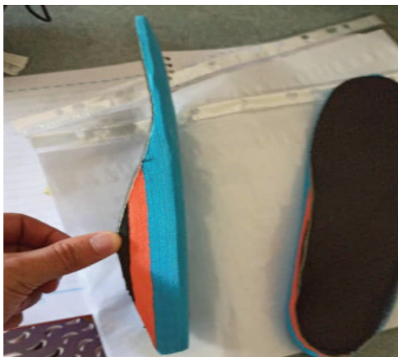
شکل ۱: کفی Arch support استفاده شده در تحقیق

آزمودنی‌ها: پژوهش حاضر از نوع شبه تجربی و آزمایشگاهی بود که به‌صورت پیش‌آزمون و پس‌آزمون و با گروه کنترل انجام شد. جامعه آماری این تحقیق هندبالیست دارای پای پرونیته بودند. از طریق توزیع فراخوان در دانشگاه محقق اردبیلی افراد مشمول در این تحقیق مورد ارزیابی قرار گرفت و ۱۰ نفر افراد دارای پای پرونیته به‌صورت دسترس و ۱۰ نفر سالم انتخاب شدند. کلیه آزمودنی‌ها قبل از آزمون رضایت‌نامه شرکت در تحقیق را تکمیل کردند. افرادی که بیشتر از ۱۰ میلی‌متر افتادگی استخوان نایکولار دارند و دارای شاخص پاسچر پا بالاتر از ۶ میلی‌متر هستند، به‌عنوان افراد دارای پای پرونیته انتخاب شدند (۳۶). برای تعیین میزان افتادگی استخوان نایکولار، اختلاف ارتفاع استخوان نایکولار از زمین در حالت پا برهنه در دو حالت با و بدون تحمل وزن (وضعیت ایستاده بر روی دو پا و وضعیت نشسته بر روی صندلی) محاسبه شد افراد دارای دامنه سنی ۱۸-۲۸ سال، دارا بودن کف پای صاف و جنسیت مرد بود. میانگین و انحراف استاندارد سن، جرم و قد آزمودنی‌ها به ترتیب برابر ۲۲.۸ \pm ۳.۷ سال، ۷۶ \pm ۱۲.۶ کیلوگرم و ۱۷۹.۶ \pm ۵.۶ سانتی‌متر بود. پروتکل این مطالعه در کمیته اخلاق دانشگاه محقق اردبیلی (با کد: Ir.uma.rec.1401.081) مورد تصویب قرار گرفت. جهت شرکت در پژوهش از آزمودنی‌ها رضایت‌نامه کتبی دریافت گردید.