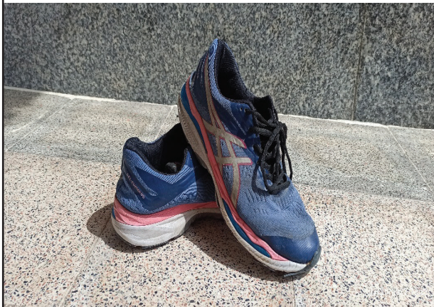
شکل ۲: کفش ASICS GEL-CUMULUS 20

نتایج بین گروهی نشان داد نرخ بارگذاری عمودی ( P = 0.032 )، ایمپالس ( P < 0.001 ) و ماکسیمم گشتاور آزاد ( P = 0.013 ) در دو گروه کنترل و پای پرونیت طی پرش اختلاف معنی‌داری داشت (جدول ۲).