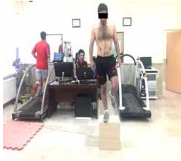
شکل ۱: فرود تک پا