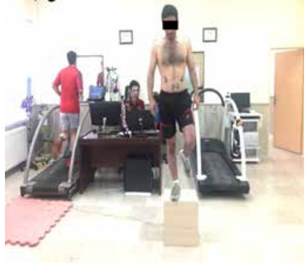
شکل ۱: فرود تک پا