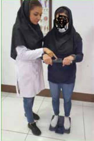
آزمون بادی کامپوزیشن

تصویر ۱. نحوه ارزیابی ویژگی‌های آنتروپومتریکی، ترکیب بدن و لندمارک گذاری