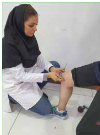
قطر کندیل ران توسط کولیس