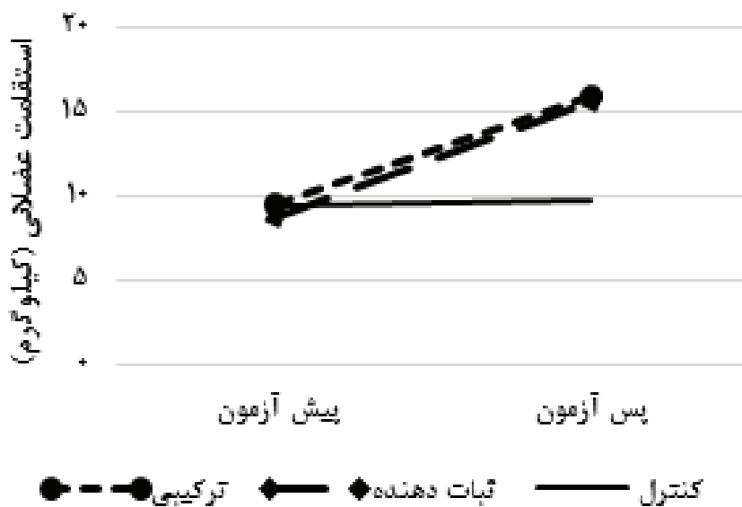
نمودار ۲: متغیر وابسته استقامت عضلانی بر اساس گروه‌ها و مراحل تحقیق