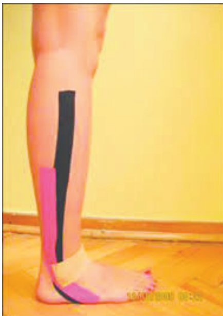
شکل ۳. نحوه انجام تیپینگ مچ پا

به پشت قرار گیرند، سپس فاصله بین خار خاصره قدامی فوقانی تا بخش دیستال قوزک داخلی پا اندازه‌گیری شد، برای هر آزمودنی و هر پا دو مرتبه تکرار و میانگین گرفته شد؛ سپس میانگین محاسبه شده به عنوان اندازه طول پا استفاده گردید. در این پژوهش از آزمون تعادلی وای استفاده شد. آزمودنی در مرکز جهات می‌ایستاد و سپس بر روی یک پا قرار می‌گرفت و با پای دیگر عمل دستیابی را انجام و به حالت طبیعی روی دو پا گرفت و پیش از انجام کوشش بعدی به مدت ۱۰ تا ۱۵ ثانیه در این حالت ماند. تمام کوشش‌ها در یک جهت قبل از رفتن به جهت دیگر باید تکمیل شدند و باید در یک ترتیب متوالی ساعت‌گرد یا پادساعت‌گرد انجام گردید. آزمودنی با پنجه پا دورترین نقطه ممکن را در هر یک از جهات تعیین شده لمس می‌کرد، فاصله محل تماس تا مرکز، فاصله دستیابی بود که جهت به‌دست آوردن اختلاف بین میانگین نمرات تعادل وای به سانتی‌متر اندازه‌گیری می‌شد (۳۱) .