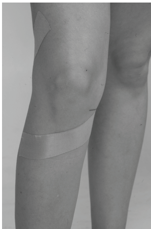
شکل ۱: تیپینگ مولیگان زانو

تیپینگ، تمامی آزمون‌های سنجش به همان شیوه پیش آزمون تکرار و در نهایت داده‌های جمع‌آوری شد. از آمار توصیفی جهت محاسبه میانگین و انحراف استاندارد، دامنه تغییرات، سن، قد، وزن و شاخص توده بدنی آزمودنی‌ها استفاده شد. همچنین برای تجزیه و تحلیل و بررسی نرمال بودن توزیع داده‌ها از آزمون کلموگروف اسمیرنوف و برای مقایسه پیش آزمون و پس آزمون، آزمون آماری تی وابسته در سطح معناداری ۹۵٪ ( \alpha \leq 0/05 ) مورد استفاده قرار گرفت. برای انجام تمام محاسبات نرم‌افزار SPSS ورژن ۲۰ و Excel استفاده شد.