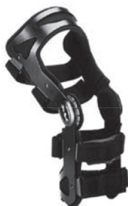
تصویر ۱. برسی زانوی Xeleton مدل 50K30

از آزمودنی‌ها خواسته شد تا به روی سکوی ۳۰ سانتی‌متری که کنار صفحه‌نیرو قرار داده داشت، قرار گیرند و بر روی دستگاه صفحه‌نیرو به صورت دو پا فرود بیایند. این آزمون در دو مرحله‌ی بدون بریس زانو و با بریس زانو صورت گرفت. طی هر مرحله، ۵ کوشش فرود صحیح که با پای برتر انجام شده بود ثبت گردید. در پژوهش حاضر از بریس زانوی Xeleton مدل 50K30 استفاده شد (تصویر ۱). این بریس ساخت شرکت Otto bock در کشور آلمان می‌باشد. از این بریس برای حمایت از توانمندی مطلوب پس از آسیب رباط صلیبی و یا پس از جراحی‌های زانو استفاده می‌شود. طراحی مناسب این بریس به آسیب‌دیدگان این اجازه را می‌دهد تا به فعالیت‌های روزمره خود برسند و نیز درجه‌ی بالایی از ثبات را به مفصل زانو می‌دهد. به لحاظ اقتصادی این بریس در بین بریس‌های موجود در بازار مقرون به صرفه می‌باشد.