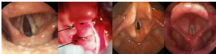
درجه ۴ دهانه باز کریکوفارنژیال