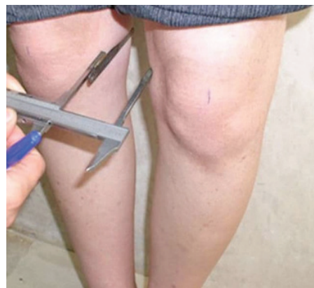
شکل ۱: میزان زاویه بین کندیلی

زاویه چهارسر زاویه تشکیل شده بین دو خط رسم شده از خار خاصره قدامی فوقانی به مرکز کشکک و از مرکز کشکک به برجستگی درشت نی است (شکل ۱). زاویه تلاقی آزمودنی ها، در وضعیت ایستاده و درحالی که لگن در وضعیت طبیعی و زانو در وضعیت باز شده قرار داشت، با استفاده گونیامتر اندازه گیری شد، بدین منظور ابتدا خار خاصره قدامی فوقانی، برجستگی درشت نی و مرکز کشکک (مرکز کشکک به وسیله نقطه تلاقی خط مرکزی عمودی و خط مرکزی داخلی/خارجی تعیین شد) روی پوست علامت زده شد. به این منظور، محور گونیامتر بر روی مرکز کشکک قرار داده شد، بازوی بلند در خار خاصره قدامی فوقانی و بازوی کوتاه روی برجستگی درشت نی قرار گرفت و زاویه بین دو بازو بر حسب درجه اندازه گیری گردید (دانشجو و ریسی، ۲۰۱۹).