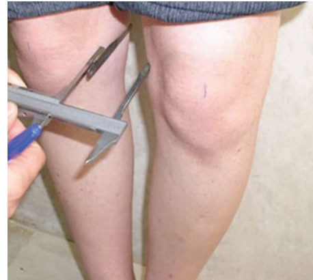
شکل ۱: میزان زاویه بین کندیلی

زاویه چهارسر زاویه تشکیل شده بین دو خط رسم شده از خار خاصره قدامی فوقانی به مرکز کشکک و از مرکز کشکک به برجستگی درشت نی است (شکل ۱). زاویه تلاقی آزمودنی ها، در وضعیت ایستاده و درحالی که لگن در وضعیت طبیعی و زانو در وضعیت باز شده قرار داشت، با استفاده گونیامتر اندازه گیری شد، بدین منظور ابتدا خار خاصره قدامی فوقانی، برجستگی درشت نی و مرکز کشکک (مرکز کشکک به وسیله نقطه تلاقی خط مرکزی عمودی و خط مرکزی داخلی/خارجی تعیین شد) روی پوست علامت زده شد. به این منظور، محور گونیامتر بر روی مرکز کشکک قرار داده شد، بازوی بلند در خار خاصره قدامی فوقانی و بازوی کوتاه روی برجستگی درشت نی قرار گرفت و زاویه بین دو بازو بر حسب درجه اندازه گیری گردید (دانشجو و ریسی، ۲۰۱۹).