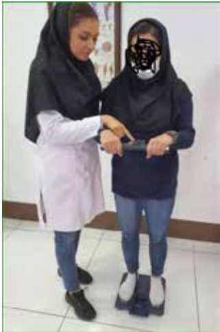
آزمون بادی کامپوزیشن

تصویر ۱. نحوه ارزیابی ویژگی‌های آنتروپومتریکی، ترکیب بدن و لندمارک گذاری