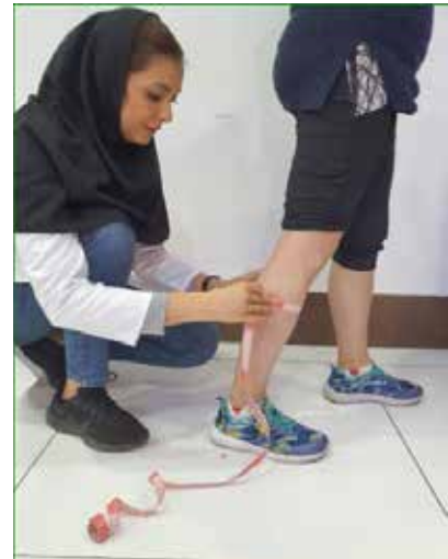
پهنای ساق با متر نواری