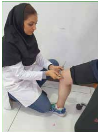
قطر کندیل ران توسط کولیس