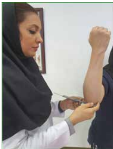
قطر کندیل بازو توسط کولیس