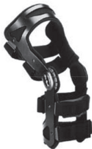
تصویر ۱. برسی زانوی Xeleton مدل 50K30

از آزمودنی‌ها خواسته شد تا به روی سکوی ۳۰ سانتی‌متری که کنار صفحه‌نیرو قرار داده داشت، قرار گیرند و بر روی دستگاه صفحه‌نیرو به صورت دو پا فرود بیایند. این آزمون در دو مرحله‌ی بدون بریس زانو و با بریس زانو صورت گرفت. طی هر مرحله، ۵ کوشش فرود صحیح که با پای برتر انجام شده بود ثبت گردید. در پژوهش حاضر از بریس زانوی Xeleton مدل 50K30 استفاده شد (تصویر ۱). این بریس ساخت شرکت Otto bock در کشور آلمان می‌باشد. از این بریس برای حمایت از توانمندی مطلوب پس از آسیب رباط صلیبی و یا پس از جراحی‌های زانو استفاده می‌شود. طراحی مناسب این بریس به آسیب‌دیدگان این اجازه را می‌دهد تا به فعالیت‌های روزمره خود برسند و نیز درجه‌ی بالایی از ثبات را به مفصل زانو می‌دهد. به لحاظ اقتصادی این بریس در بین بریس‌های موجود در بازار مقرون به صرفه می‌باشد.