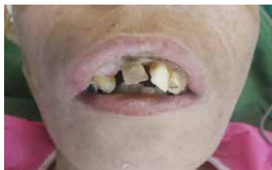
عکس ۱: وضعیت دهان و فک و دندان‌های بیمار

به‌عنوان یک نتیجه‌گیری در بیماران مبتلا به تالاسمی مازور با توجه به درگیری استخوان‌های صورت و اداره راه هوایی مشکل، لوله‌گذاری با لارنگوسکوپ فیبروپتیک می‌تواند روش مفید و بدون عارضه‌ای باشد و باید همچنین در نظر داشت که این بیماران با توجه به مشکلات همراه با این سندروم در طی عمل‌های جراحی مستعد مشکلات دیگری نیز می‌باشند که می‌بایست توجهات لازم قبل و حین جراحی در این بیماران صورت گیرد.