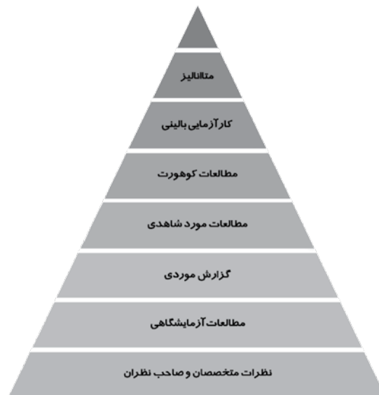
تصویر ۱: هرم مبتنی بر شواهد

با در نظر گرفتن ملاحظات اخلاقی و عدم پیش داوری درمورد داروی خاص مطالعات مورد بررسی قرار گرفت و بهترین داروها (داروهای دارای بیشترین کارایی و کمترین عارضه در کنترل درد حاد پس از اعمال جراحی ارتوپدی) به همراه بهترین دوز، روش و زمان تجویز آن‌ها انتخاب شد. با هماهنگ نمودن جلسه هم‌اندیشی با حضور ۱۰ نفر از اعضای هیات علمی به