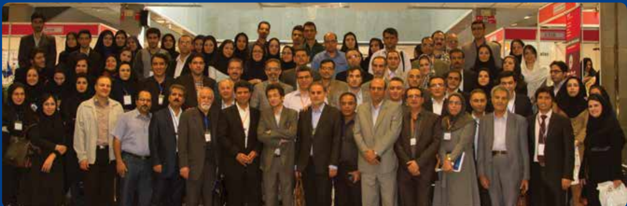
انجمن ژئوئال آنستزی و درد ایران