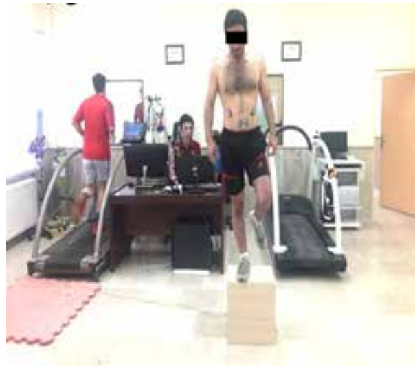
شکل ۱: فرود تک پا