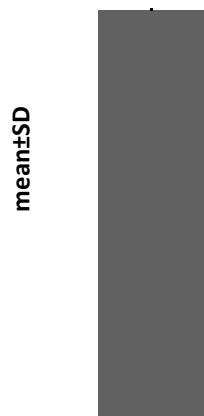
شکل ۲- توزیع زمان درخواست مسکن به دقیقه پس از پایان بی‌حسی نخاعی در سه گروه