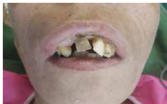
عکس ۱: وضعیت دهان و فک و دندان‌های بیمار

به‌عنوان یک نتیجه‌گیری در بیماران مبتلا به تالاسمی مازور با توجه به درگیری استخوان‌های صورت و اداره راه هوایی مشکل، لوله‌گذاری با لارنگوسکوپ فیبروپتیک می‌تواند روش مفید و بدون عارضه‌ای باشد و باید همچنین در نظر داشت که این بیماران با توجه به مشکلات همراه با این سندروم در طی عمل‌های جراحی مستعد مشکلات دیگری نیز می‌باشند که می‌بایست توجهات لازم قبل و حین جراحی در این بیماران صورت گیرد.